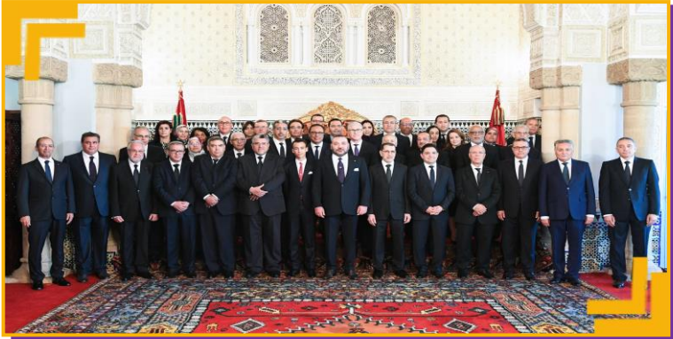
حكومة سعد الدين العثماني

ولعل أول ضحايا هذا التطبيع ستكون حكومة سعد الدين العثماني ذات التوجه الإسلامي التي وقعت بين فكي كماشة: قناعتها بسقف مؤسسة العرش والتزامها الكامل به، وقناعتها بدعم القضية الفلسطينية ورفض التطبيع، وهي الموازنة الصعبة التي جلبت نقداً هجوماً مركزاً لم تستطع الحكومة والحزب الرئيسي فيها "العدالة والتنمية" تقديم خطاب مقنع لجمهورها بالإضافة إلى الجمهور العام غير المؤثر لها.